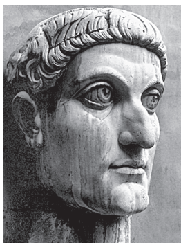
Константин Великий. Голова от гигантской статуи, в восемь раз превышавшей человече- ский рост и изготовленной в Риме около 315 г. (Пала- тинский дворец)

или город, названный в честь основателя Византием.