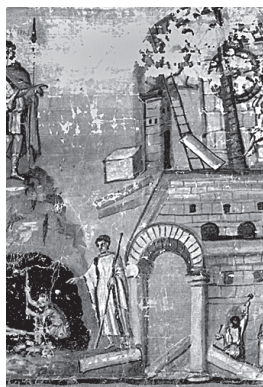
Строительство Города. Миниатюра из Ватиканской рукописи Вергилия, V в.

С IX в. и вплоть до 1204 г. Константинополь непрерывно рос. При этом отмечают два пика роста: в начале X в., при Романе Лакапине, и в конце XI в., при Алексее Комнине. В Городе велось новое строительство, бурлила интеллектуальная жизнь, открылась философская школа, шли богослов-