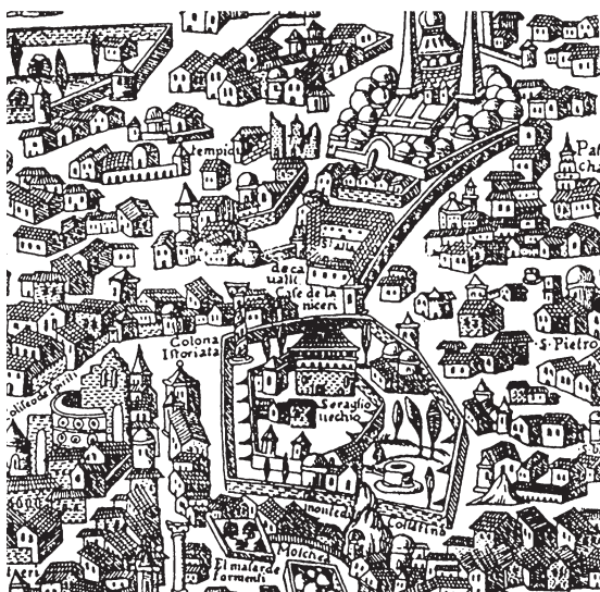
Андреа Вавасоре. Панорама Константинополя, XVI в.

По легенде, сначала город хотели основать в верховьях залива Золотой Рог (где музейно-выставочный центр Santral Istanbul ), но когда поставили алтарь и собирались принести жертву, орел схватил сердце жертвенного животного и перенес его на оконечность полуострова; это место с юга омывали воды Мраморного моря, с востока — воды Босфора, а с севера — воды залива Золотой Рог. Здесь было пересечение самых важных торговых путей: из Европы в Азию и из Черного моря в Средиземное. Тут и постро-